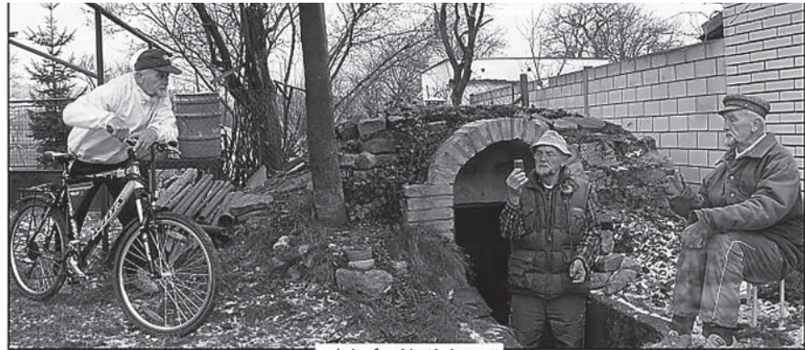
...ať nám chutná i v Novém roce !!!

A nejen ať nám chutná, ale ať jsme zdraví a mnoho šťastných kilometrů bez nehod a defektů!