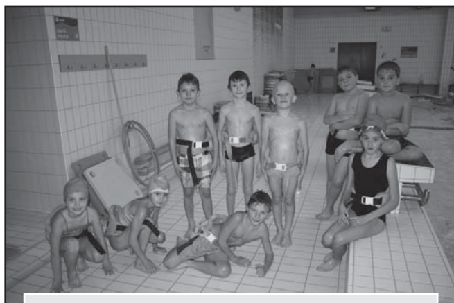
Plavání v Delfínu v Uherském Brodě