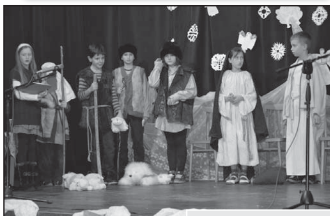
Vánoční besídka v obecním sále