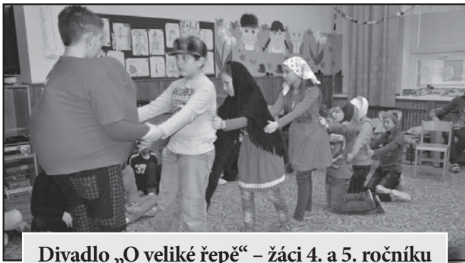
Divadlo „O veliké řepě“ – žáci 4. a 5. ročníku