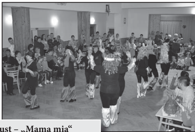
Sucholožský masopust – „Mama mia“