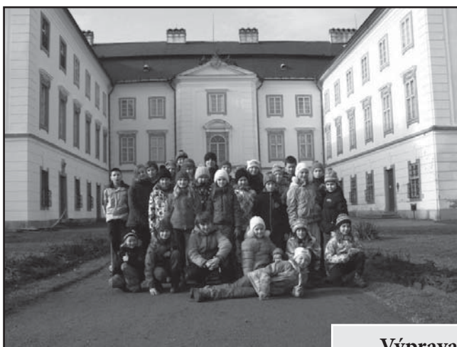
Výprava do Vizovic