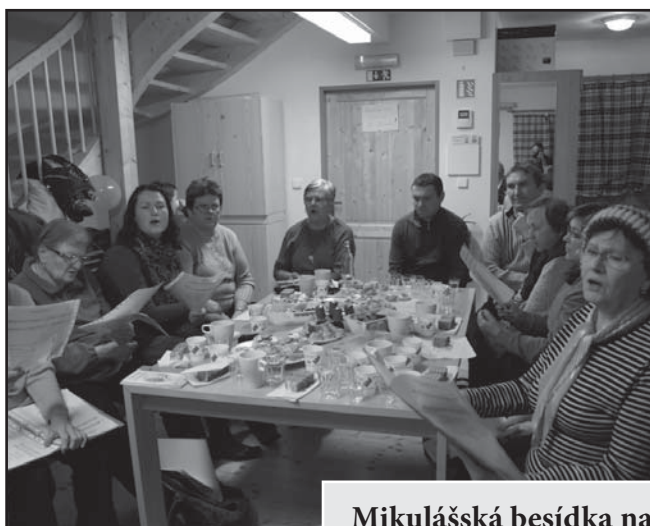
Mikulášská besídka na skautské chatě Podhorce