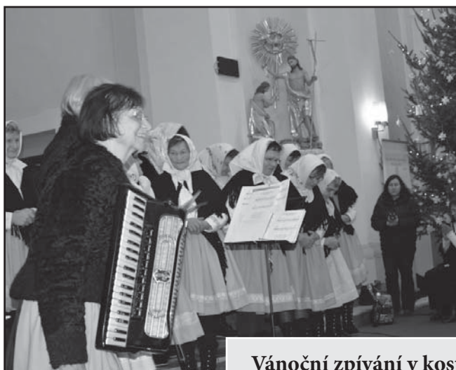
Vánoční zpívání v kostele sv. Martina v Bánově