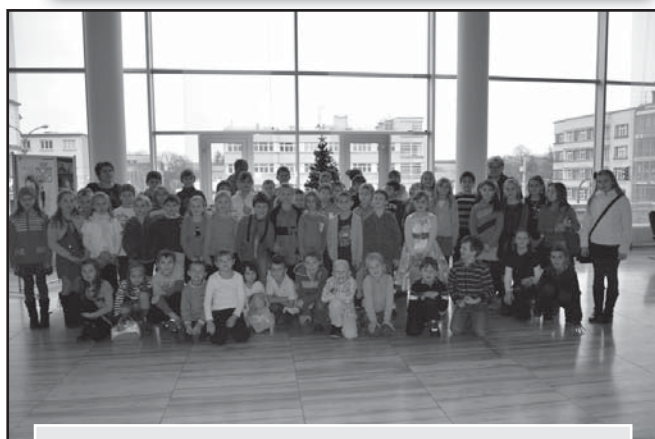
Divadelní představení ve Zlíně