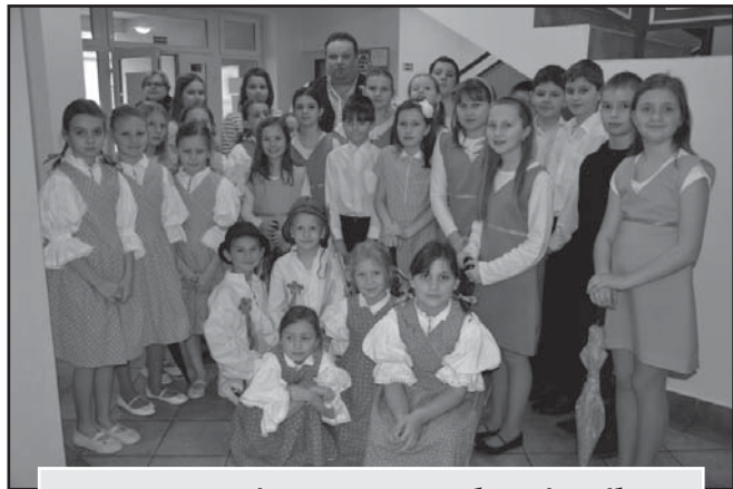
Vystoupení pro seniory v obecním sále