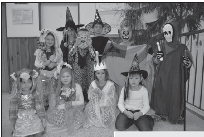
Karneval ve školní družině a v 1. třídě