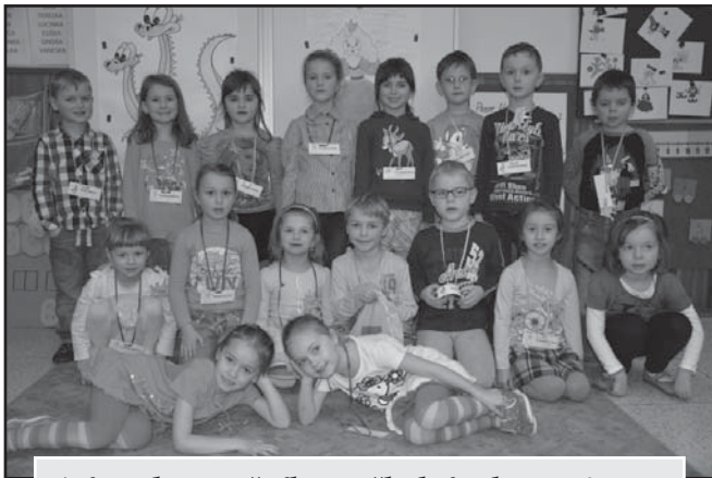
Zápis do 1. ročníku na školní rok 2014/2015