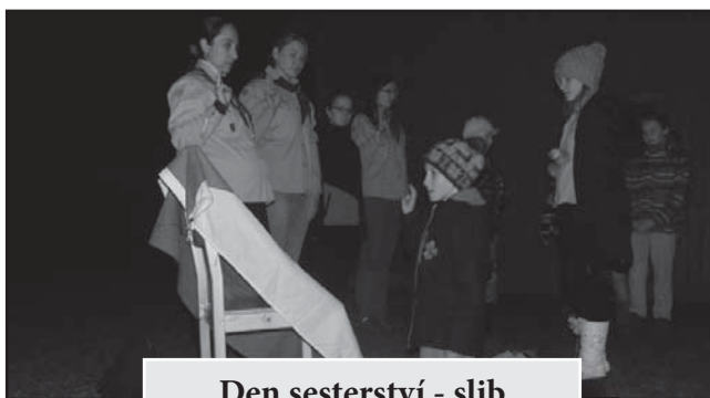
Den sesterství - slib