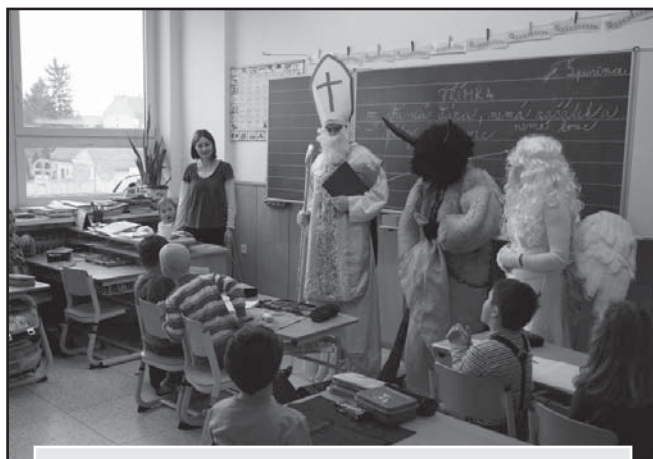
Sv. Mikuláš ve škole