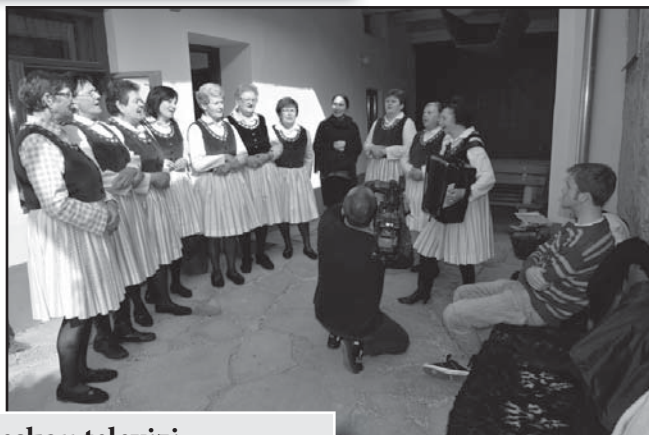
Natáčení pro Českou televizi – regionální vysílání – vaření kyselice