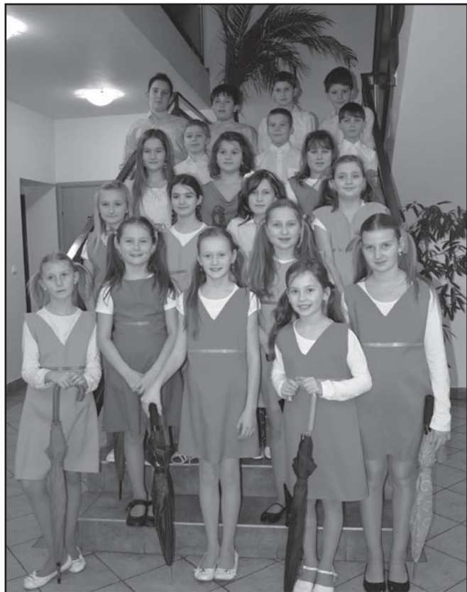
Předtančení na obecním plese – žáci 4. a 5. ročníku

Každoročně probíhá zápis do 1. ročníku. U nás ve škole se koná většinou první týden v únoru. I letos tomu nebylo jinak. Své budoucí prvňáčky doprovodili rodiče, kteří se první poloviny zápisu také zúčastnili. Ve druhé části děti prokazovaly své znalosti z matematických představ, jazykové výchovy, musely přednést báseň a nakreslit postavu. Rodiče měli za úkol zase vyplnit různé formuláře, prohlédnout si učebnice, podle kterých se budou jejich děti vzdělávat. 1. září u nás ve škole přivítáme 14 prvňáků. Už se na Vás moc těšíme.