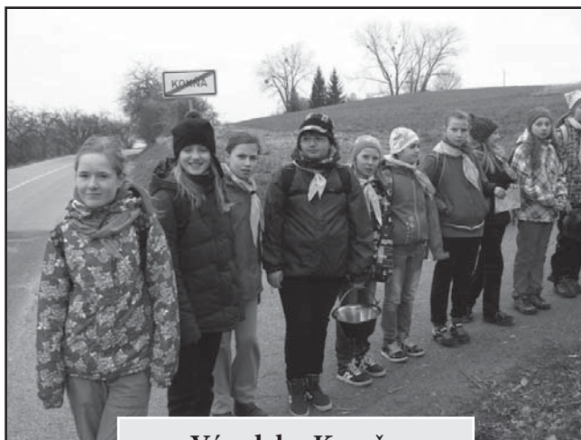
Výsadek - Komňa